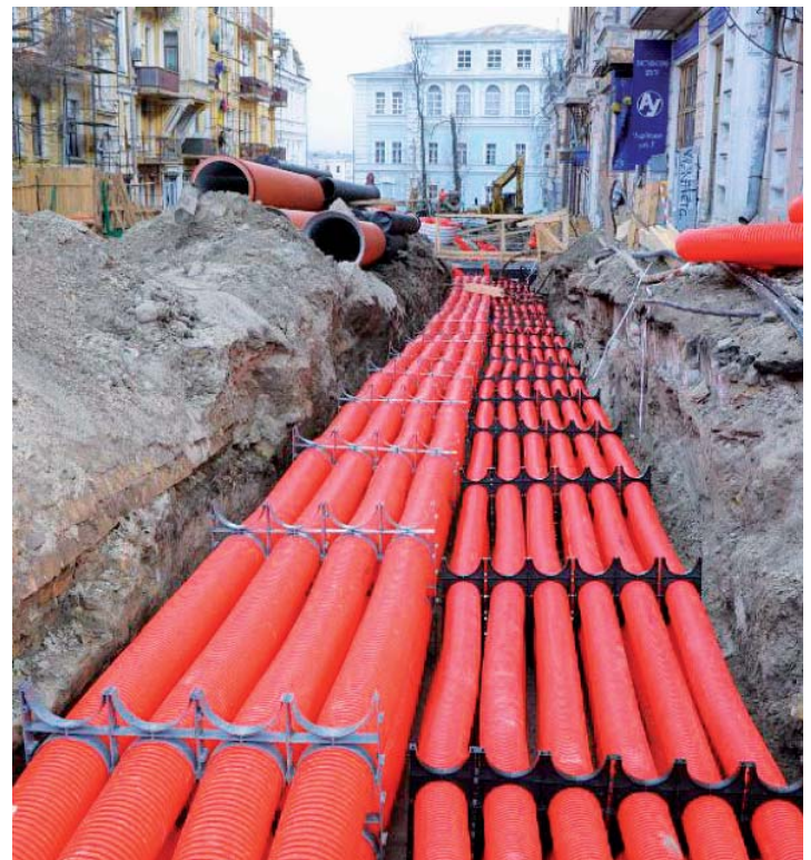
Рис. 5. Кабельные линии 0,4 кВ, уложенные в двустенную гофрированную трубу и располагаемые в траншее

Причина очень проста — эти гофрированные трубы не могут быть проложены методом горизонтально направленного бурения (ГНБ), ставшего незаменимым при прокладке кабелей 6—500 кВ, ведь для использования ГНБ труба должна быть стойкой к растяжению (важно при затяжке трубы в грунт) и