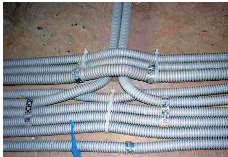
Рис. 2. Электропроводка 0,4 кВ, выполненная гофрированными трубами

Внутренний слой из ПВД — это всего лишь своеобразная основа, на которую наклеивается внешний слой из ПНД, что позволяет увеличить кольцевую жёсткость трубы, не теряя её гибкости. Однако при этом применение мягкого и вязкого ПВД-слоя создаёт дополнительное сопротивление при протяжке