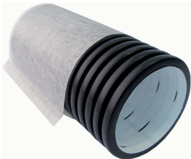
Рис. 1. Дренажная гофрированная труба с перфорацией, обмотанная геотекстилем

С целью предотвращения попадания мелких частиц грунта внутрь трубы снаружи она оборачивается геотекстилем (на рис. 1 это светло-серая ткань).